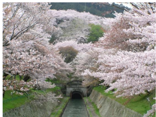
** 琵琶湖の水を京都へ送る 琵琶湖疎水沿いは桜の名所です。

桜蔭会滋賀支部は、会員数 50 人前後の比較的小さな支部です。年 2 回の支部便りを発行するほか、ミニ旅行を通じて会員間の親睦をはかっています。他府県出身者が多いのも特徴で、懇親会が「湖国の観光・再発見」にもなっています。