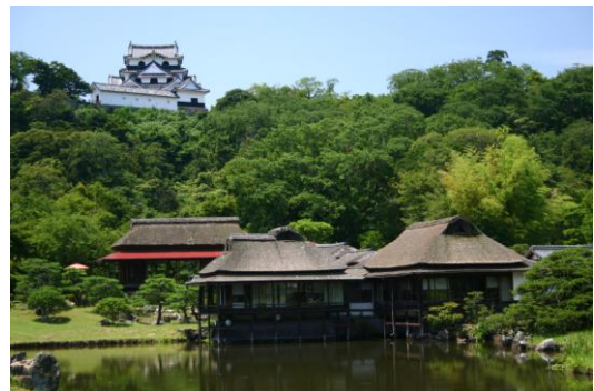
** 名勝玄宮園から望む彦根城

桜蔭会滋賀支部は、会員数 50 人前後の比較的小さな支部です。年 2 回の支部便りを発行するほか、ミニ旅行を通じて会員間の親睦をはかっています。他府県出身者が多いのも特徴で、懇親会が「湖国の観光・再発見」にもなっています。