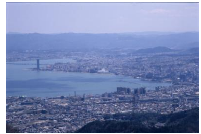
* 琵琶湖と大津市街地

滋賀県は、周囲約 235 kmの琵琶湖と、その周りを伊吹、鈴鹿、比良の山々に囲まれた自然豊かな地です。内陸県ながら漁港をもち、古くから日本海と上方をつなぐ湖上交通が発達し、東海道、中山道、北陸道の合流する要所でもありました。