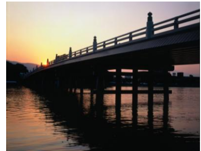
* 交通の要衝 瀬田の唐橋

世界文化遺産に登録されている“比叡山延暦寺”，その天守閣が国宝四城の一つである“彦根城”のほか、壬申の乱の舞台となった“大津京”，織田信長の築いた“安土城跡”，大津で最期を遂げた木曾義仲と近江を愛した芭蕉の墓所“義仲寺”などの名所旧跡があります。この自然と歴史に恵まれた県下の各地で映画やドラマの撮影もさかんです。