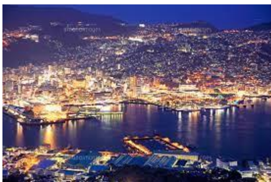
稲佐山山頂展望台から望む 長崎の街