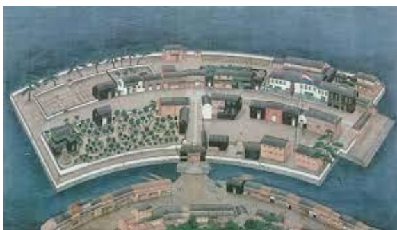
江戸時代後期の出島図