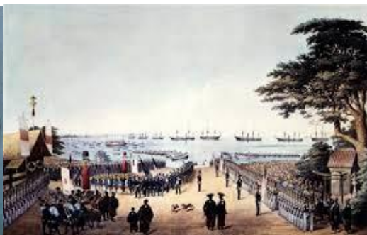
ペリー提督一行の横浜上陸