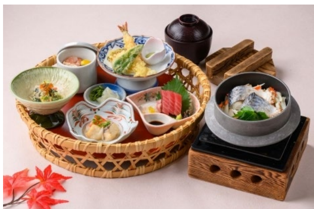
津みやび 季節の花かご膳

2025年11月24日（月祝）11時～13時、毎年恒例の三重支部総会およびランチ会を津駅直結のホテルグリーンパーク津2階、和食料理「津みやび」にて開催しました。今年も7名の方にご参加いただきましたがメンバーは入れ替わり、初参加の方・久しぶりの方・毎年ご出席の方と、多様なお立場ではありましたがあつという間に打ち解け、おしゃべりを楽しみながら季節の花かご膳をいただきました。