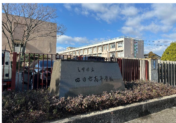
三重県立四日市高等学校

2025 年 2 月 14 日、三重支部会員 3 名で三重県立四日市高等学校を訪問し、1 年生 2 クラスに特別授業をさせていただきました。このボランティア活動は桜蔭会のホームページや連絡協議会で支部の取り組み例の一つとして紹介されました。